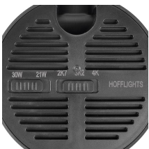
Switch de temperatura y de potencia ajustables